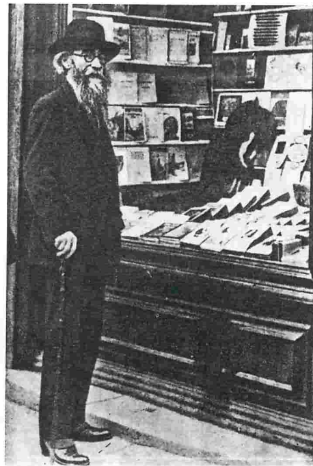
● Don Ramón María del Valle Inclán.