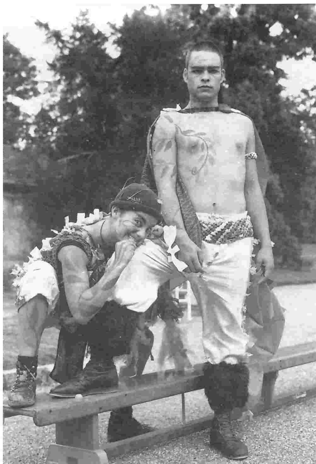
● Puck y Oberon, interpretado por actores de la RESAD.

— Yo tengo mucho contacto con los ingleses y hay mil formas distintas de trabajar, así co-