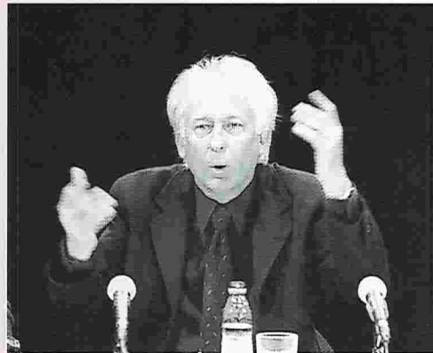
● Conferencia de Albert Boadella.