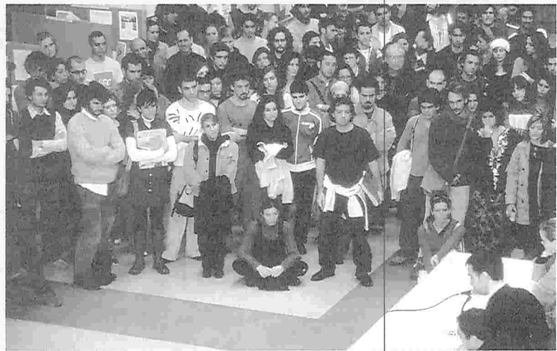
● Lectura de la declaración por una Ley de Enseñanzas Artísticas.

Emplazamos a los diversos partidos políticos para que incluyan en sus programas para las elecciones legislativas del próximo mes de marzo, el compromiso de proceder, dentro del año 2004, a la elaboración y aprobación, en las Cortes Generales, de la Ley de Enseñanzas Artísticas. Para ello, nos ponemos a su entera disposición y les ofrecemos toda nuestra experiencia y conocimiento.