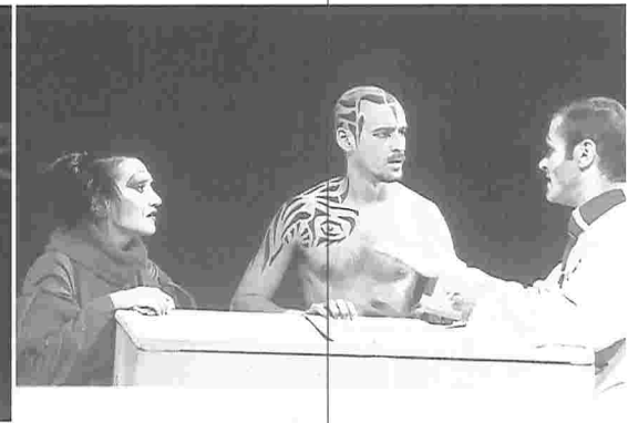
● Después de la lluvia.