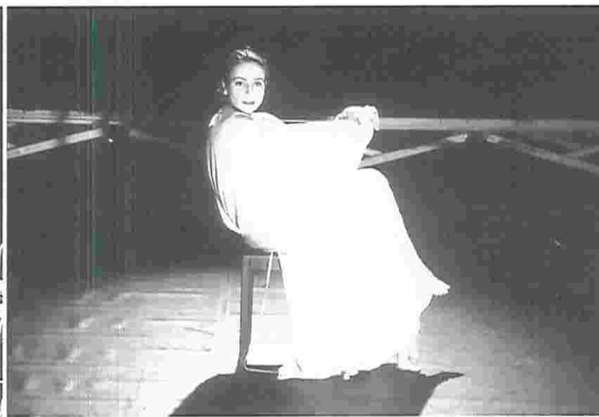
● Garbo ríe.