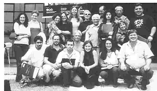
● Participantes en el Foro de Voces de Sao Paulo.

Del 14 al 18 de octubre tuvo lugar en la ciudad de Sao Paulo un interesante encuentro de profesores de los departamentos de voz de las distintas escuelas superiores y universidades de teatro iberoamericanas.