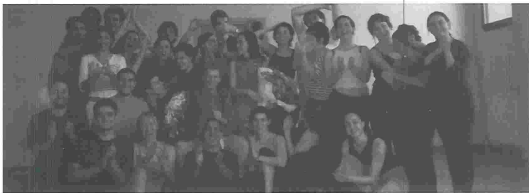
● Marcel Marceau y los participantes en el curso de mimo.