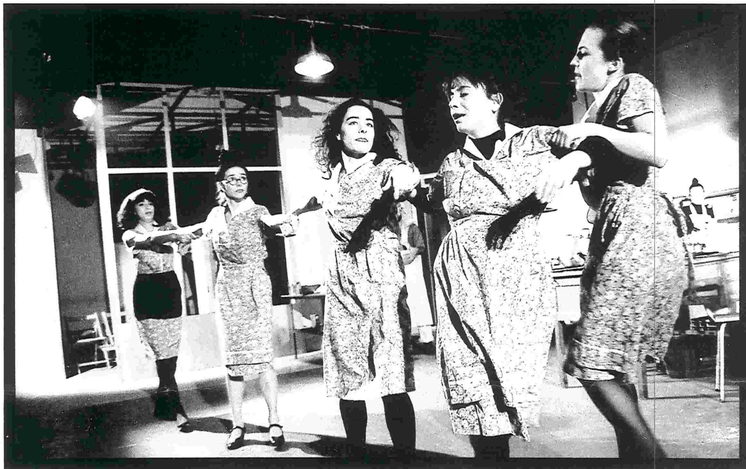
• NUESTRA COCINA. Versión de la RESAD de LA COCINA de Arnold Wesker •