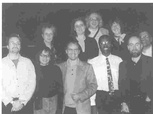
● AMES 98: participantes.

Se preparó un programa en el que participarán profesores de distintas culturas, orígenes y