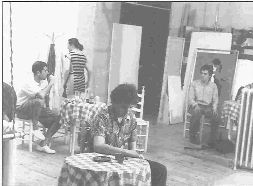
● ADVERTENCIA PARA BARCOS PEQUEÑOS de T. Williams.

Han transcurrido ya varios años desde el momento en que las principales escuelas de Arte Dramático del país iniciamos una serie de reuniones en torno a lo que entonces no era más que un primer proyecto sobre la nueva ley de educación. En aquellos titubeantes documentos previos se contemplaba la reorganización de las enseñanzas teatrales. Se acordó entonces que en el intento ministerial existía, sin duda, sincera voluntad de actualizar unas enseñanzas plagadas, hasta entonces, de contradicciones y sumidas en un olvido intolerable. El intento —histórico para nosotros— partía, pues, de la nada y podría llegar a la más absoluta miseria, salvo que los responsables del Ministerio de Educación y Ciencia fueran asesorados por quienes impartían las disciplinas teatrales. Así se expresó y así fue aceptado por el MEC.