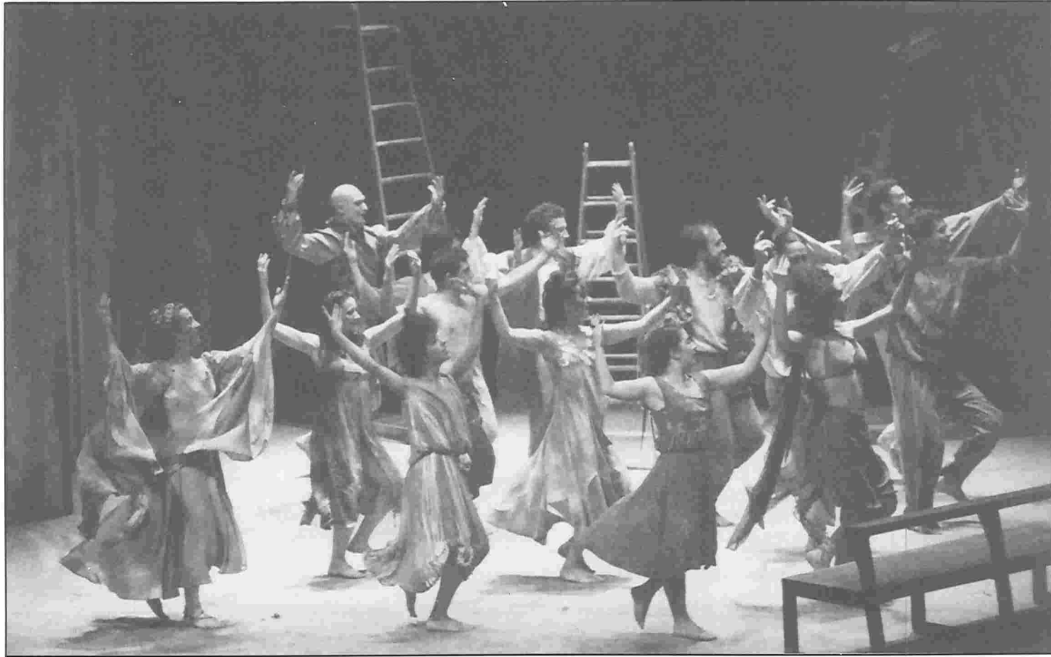
● EL AMOR ENAMORADO, de Lope de Vega, Taller 1991 de la RESAD ●