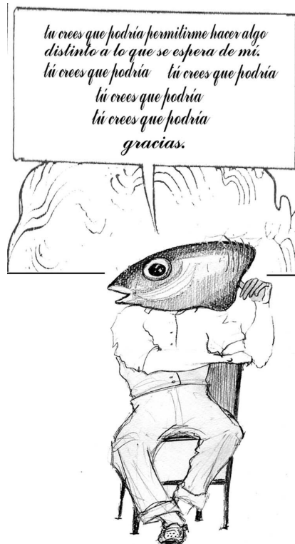
Ilustración de Ikerne Giménez de la obra Destino Desierto (1996).

El teatro de Ernesto Caballero se caracteriza por una gran perfección técnica, nacida de su conocimiento del medio teatral y por la sabia utilización de modelos tomados de la mejor tradición dramática mundial: Calderón y Shakespeare, pero también Pinter, Priestley y Bertolt Brecht, así como la revista musical y el espectáculo televisivo aparecen en sus obras transformados mediante una visión modernísima que convierte los modelos en creaciones muy personales.